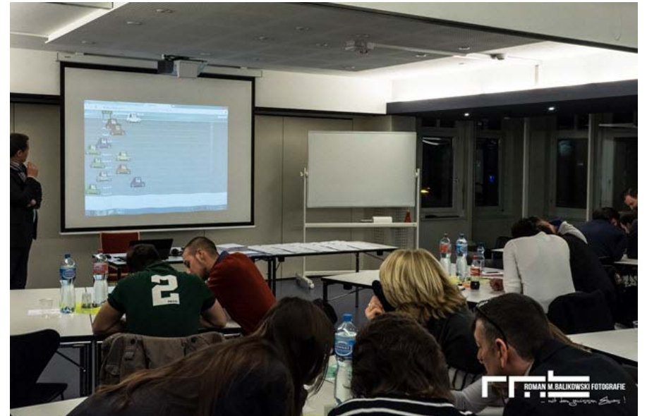
Beispiel eines Live-Quizzes mit 50 Teilnehmenden

Gamification im Unterricht ist ein echtes Profilierungsinstrument, insbesondere gegenüber jüngeren Zielgruppen. Ein entsprechender Hinweis darauf, dass auch im Unterricht Ihrer Schule solche Quizzes eingesetzt werden, kann beim Interessenten die Teilnahme am Lehrgang entscheidend beeinflussen.